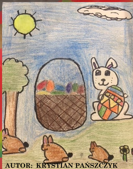
AUTOR: KRYSZTOF PANSZCZYK

Uwaga ! Kto jest autorem słów: „Piłka jest okrągła, a bramki są dwie”? Pierwsza prawidłowa odpowiedź zostanie nagrodzona.