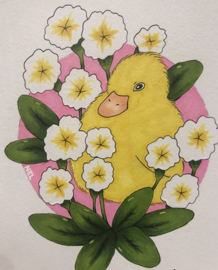
AUTOR: NEL GRUDZIŃSKI