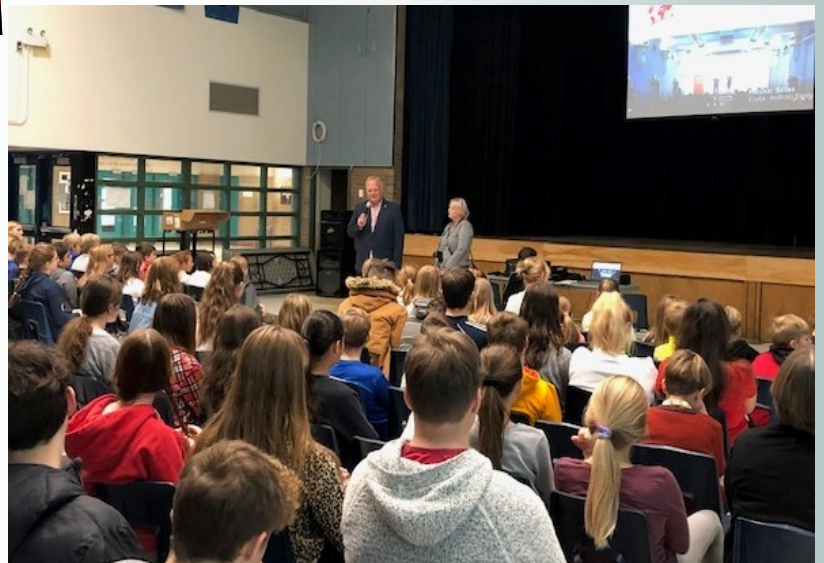
Prezentacja z Festiwalu Filmowego “Losy Polaków”