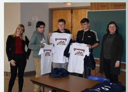
Wycieczka na UofT