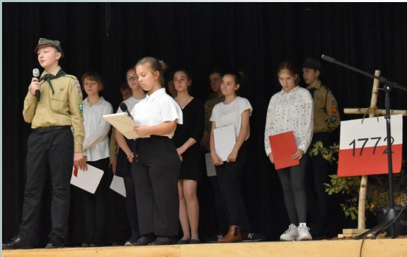
Akademia z okazji Święta Niepodległości